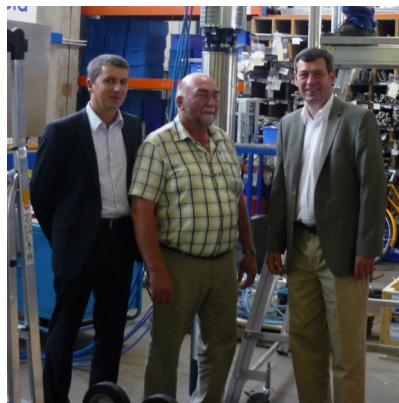
Foto links: Betriebsbesuch bei GWE Pumpenboese mit Ortsbürgermeister Gustav Kamps. Foto o. r.: Besuch mit Olaf Lies bei Landrat Franz Einhaus. Foto u. r.: Besuch von Stefan Schostak in der Fuhsesstadt.